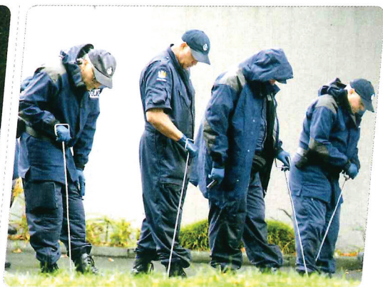
▲ 2019年3月17日,在新西兰克赖斯特彻奇,安全人员在事发清真寺附近搜索。

势。短视频一般时长30秒至1分钟,以提高碎片化阅读效率。这要求一线记者在采访时大量增加视频片段的采集数量,并努力提高质量。作为摄影记者,要随时提醒自己“拍视频”。