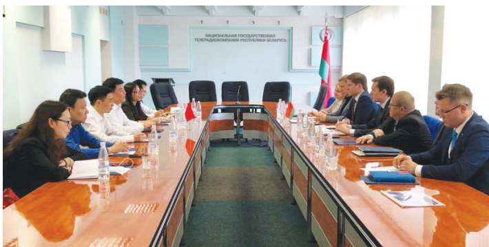
在白俄罗斯国家广播电视台采访