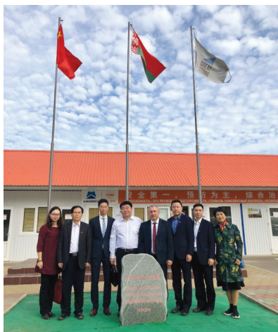
笔者(左二)在中白工业园奠基石前合影留念

指着各种模型和规划图,边详细地介绍了园区建设的地理位置、整体布局、发展状况和未来发展方向。他特别自豪地说:“园区总体规划面积为91.5平方公里,几乎占明斯克市总面积的1/3,其中一期用地面积8.5平方公里。这里毗邻国际机场、铁路和多条欧洲高速公路。从2015年起步至今,短短3年,在两国政府的全力支持下,正在发生巨变。目前,27万平方米生产经营及配套设施全部通过验收。现已有37家企业入园,除了中白两国的企业外,还包括美国、德国、立陶宛、奥地利、以色列等国的企业,涵盖机械设备、电子通信、新材料、生物医药、无人驾驶汽车、物流等多个领域。中方股东以中工国际工程股份有限公司为主,占股68%,白方股东为明斯克市政府等部门,占股32%。国家商务部通过政府间无偿援助项目给予重点扶持。今年5月,白方政府决定从明斯克市到园区单独规划建设一条公路或轨道。现在国内慕名前来考察投资的企