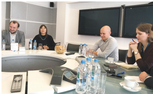
在俄罗斯卫星通讯社总部座谈交流