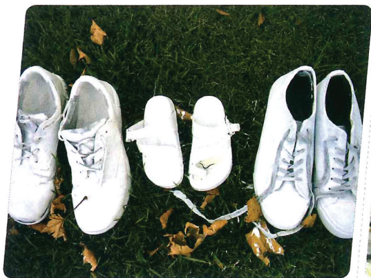
▲ 2019年3月20日,新西兰克赖斯特彻奇一座教堂外摆放着50双刷成白色的鞋子,象征着50名在3月15日恐袭案中的遇难者。

反观新西兰当地媒体如《先驱报》、STUFF新闻网等常常在移动终端采用大量文图结合短视频混编形式呈现内容,且短视频数量呈上升趋势。